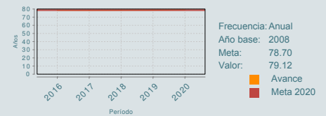
Cobertura de atención integral PREVENIMSS